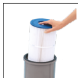
Elemento filtrante de fácil desmontaje